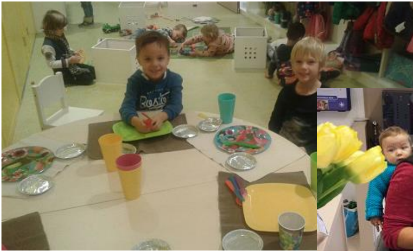
Het restaurant is geopend!