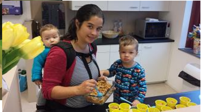
Hmmm, wat een lekkere gezonde traktatie!