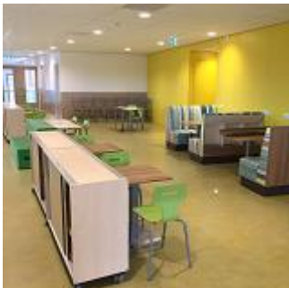
De bovenverdieping, het wordt al wat!

kb = Kleutergroep Jolanda pg = Peutergroep Sterrenrijk MR = Midden Ruimte k = keuken sl = Speellokaal SR = Sterrenrijk.